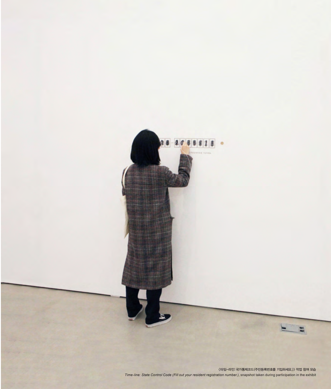
〈타임-라인: 국가통제코드(주민등록번호를 기입하세요.)〉 작업 참여 모습 Time-line: State Control Code (Fill out your resident registration number.), snapshot taken during participation in the exhibit