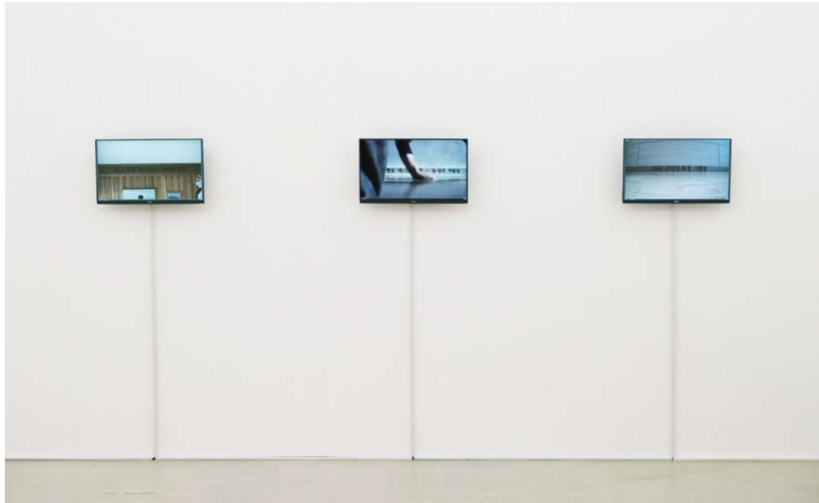
〈타임-라인: 국가통제코드 (나의 출생연도)〉 실시간 모니터 전경 Time-line: State Control Code (My Birth Year) , live streaming screens during the exhibition