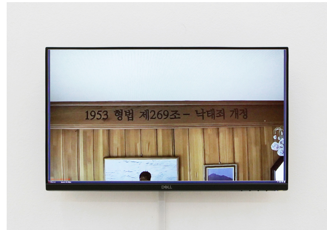
〈타임-라인: 국가통제코드(나의 출생연도)〉, 실시간 모니터 전경 주거공간 내 몰딩선 위 지연제 섞인 페인트로 칠해진 텍스트, 5대의 CCTV 카메라와 전시용 모니터 Time-line: State Control Code (My Birth Year), live streaming screens during the exhibition texts wet-painted on the participants' living space interior molding, CCTV cameras, and monitors