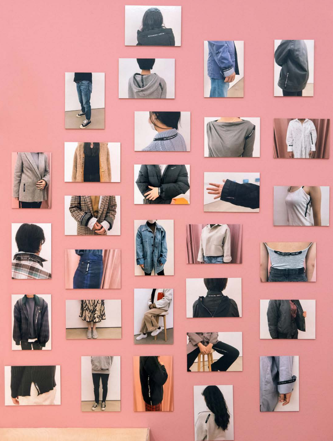
〈타임-라인: 국가통제코드(검정리본밴드)〉, 전시 중 촬영사진 Time-line: State Control Code (Black Ribbon Band), snapshots taken during the exhibition